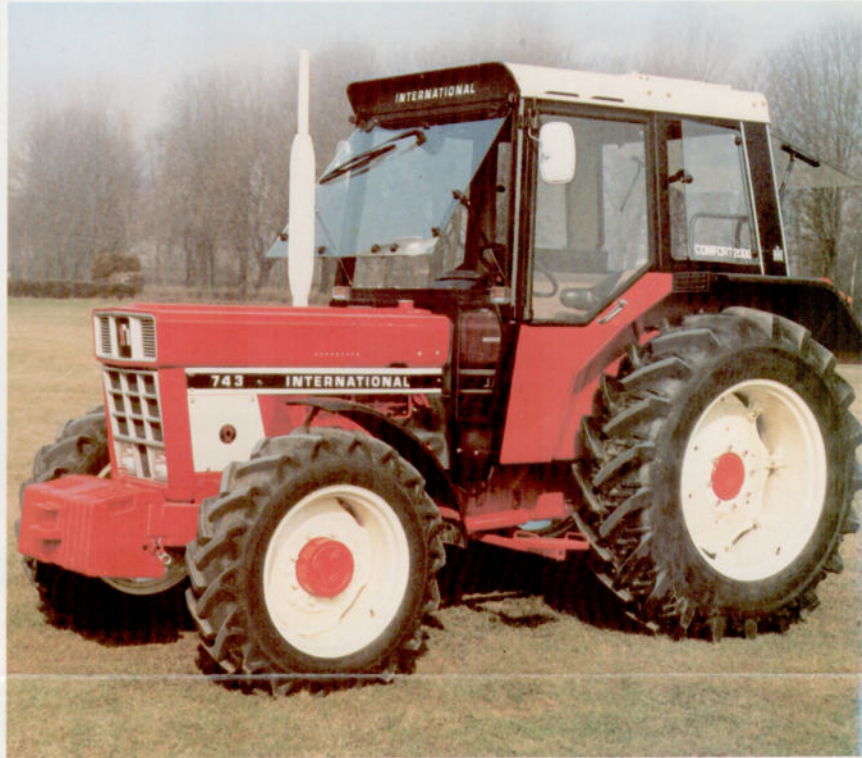
743 49 kW (67 PS)