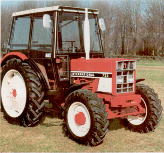
733 44 kW (60 PS)

Die neue geräumige Komfortkabine mit ausstellbarer Front- und Rückscheibe bietet dem Fahrer den Komfort, den er braucht und auch verdient.