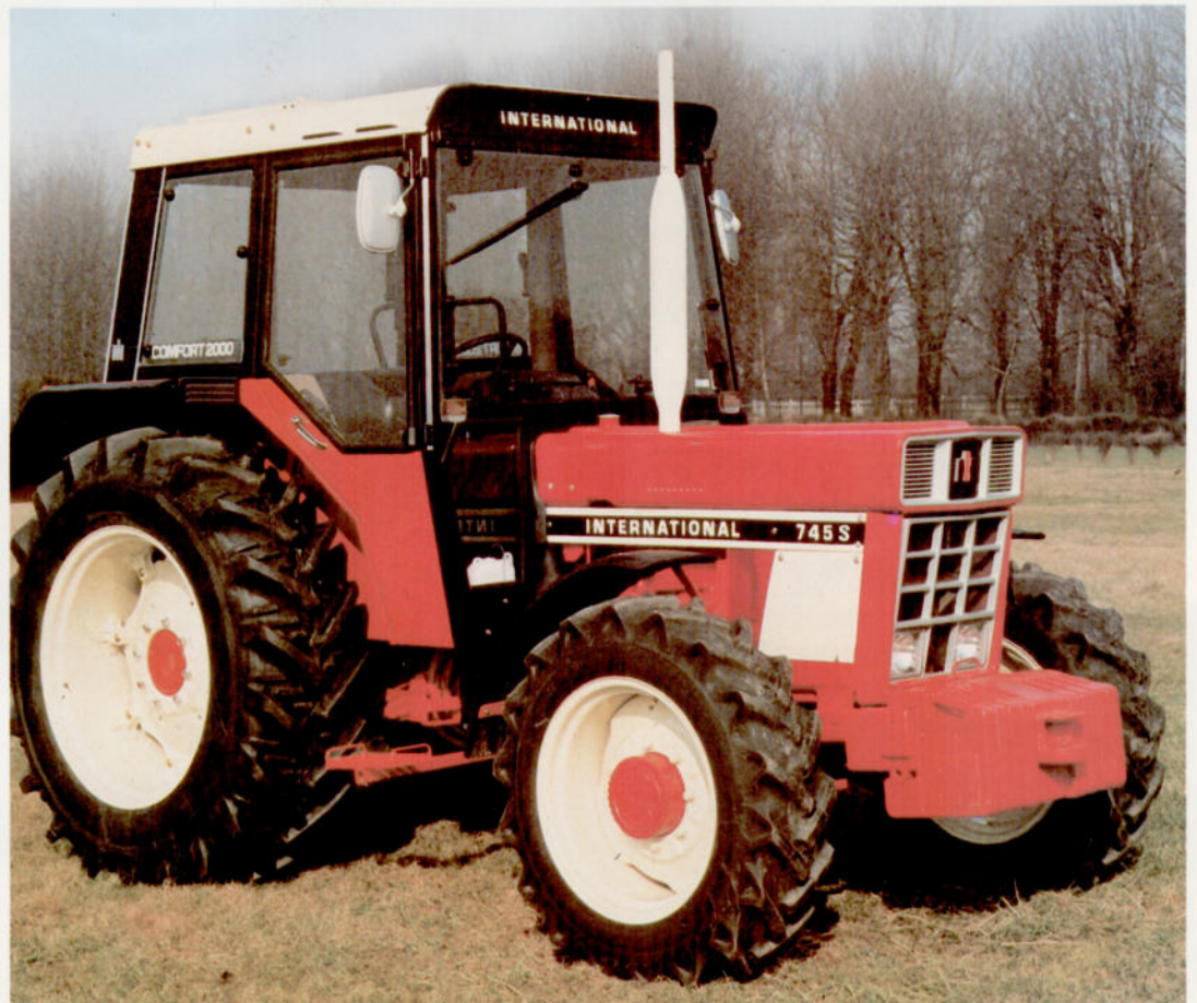
745 S 53 kW (72 PS)