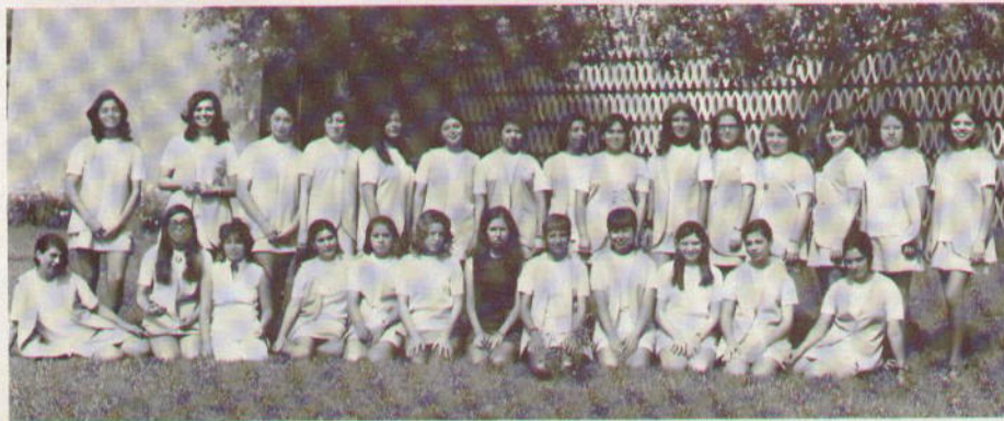
Diese Foto fröhlicher Mädchen flatterte uns vor kurzem ins Haus und gab uns auf charmante Art davon Kunde, daß die International Harvester Mexico S. A. ihr 25-jähriges Jubiläum feierte. Die Damen sind unanahmslos im Werk Saltillo (Coahuila) beschäftigt. In diesem Werk werden hauptsächlich Ackerschlepper (die Typen 523, 624, 724 sowie 766 und 866 mit deutschen Einbaumotoren) und der International Lkw D 1500 hergestellt. Das Programm wird ergänzt durch eine Vielzahl landwirtschaftlicher Anbau- und Anhängengeräte.