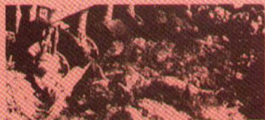
Las demostraciones en el campo son convincentes de la calidad de los productos IH.

que, con los sistemas más avanzados de fabricación y riguroso control de calidad, producen equipo para la industria, la agricultura y el transporte.