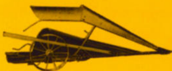
Der zweiteilige Stahlaufenteiler ist den Bodenverhältnissen entsprechend leicht und vielseitig einstellbar. Er kann auch mit großem, verstellbarem Getreideaufrichter ausgerüstet werden.