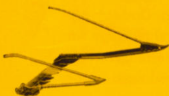
Ährenheber sind zuverlässige Helfer bei der Ernte schwierigsten Lagergetreides.

Alle Teile, mit denen das Bindegarn geknotet wird, sind gehärtet und poliert. Sorgsamste Fertigung und viele Prüfvorgänge bieten die Gewähr für einwandfreies Arbeiten.