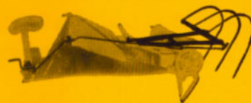
Der Eckengarbenräumer sammelt am Gewende die Garben vom Bindetisch und legt sie nach Wunsch ab. Die Bedienung erfolgt durch Fußhebel vom Sitz aus.