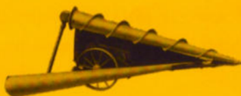
Der rotierende Außenteiler mit Kardantrieb ist zusammen mit dem verstellbaren Getreideaufrichter ein besonders geeignetes Zubehörteil bei der Bergung von Lagergetreide.