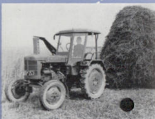
Wetterschutz in der Heuernte