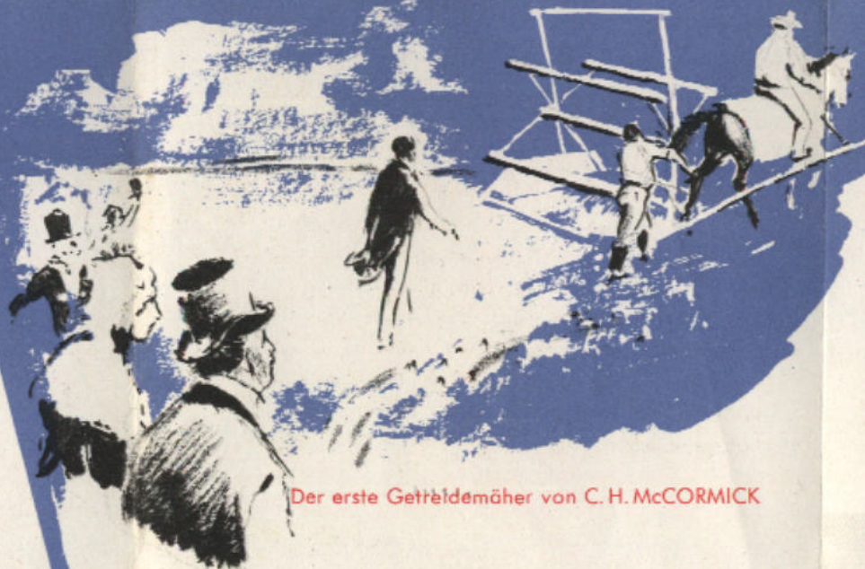
Der erste Getreidemäher von C. H. McCORMICK

1831 führte C. H. McCORMICK die erste brauchbare Getreideerntemaschine vor.