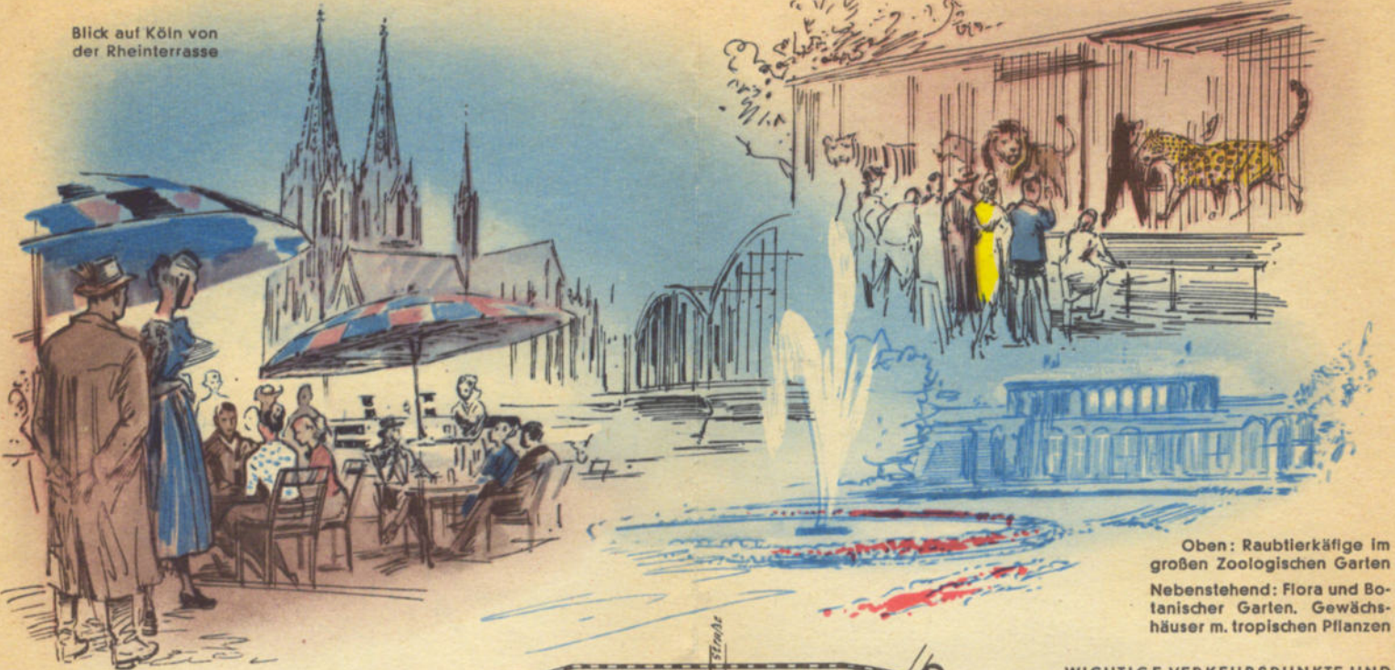
Oben: Raubtierkäfige im großen Zoologischen Garten Nebenehend: Flora und Botanischer Garten, Gewächshäuser m. tropischen Pflanzen