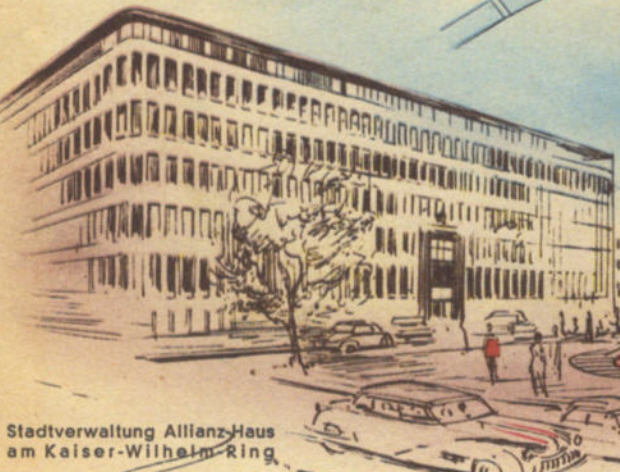
Stadtverwaltung Allianz-Haus am Kaiser-Wilhelm-Ring