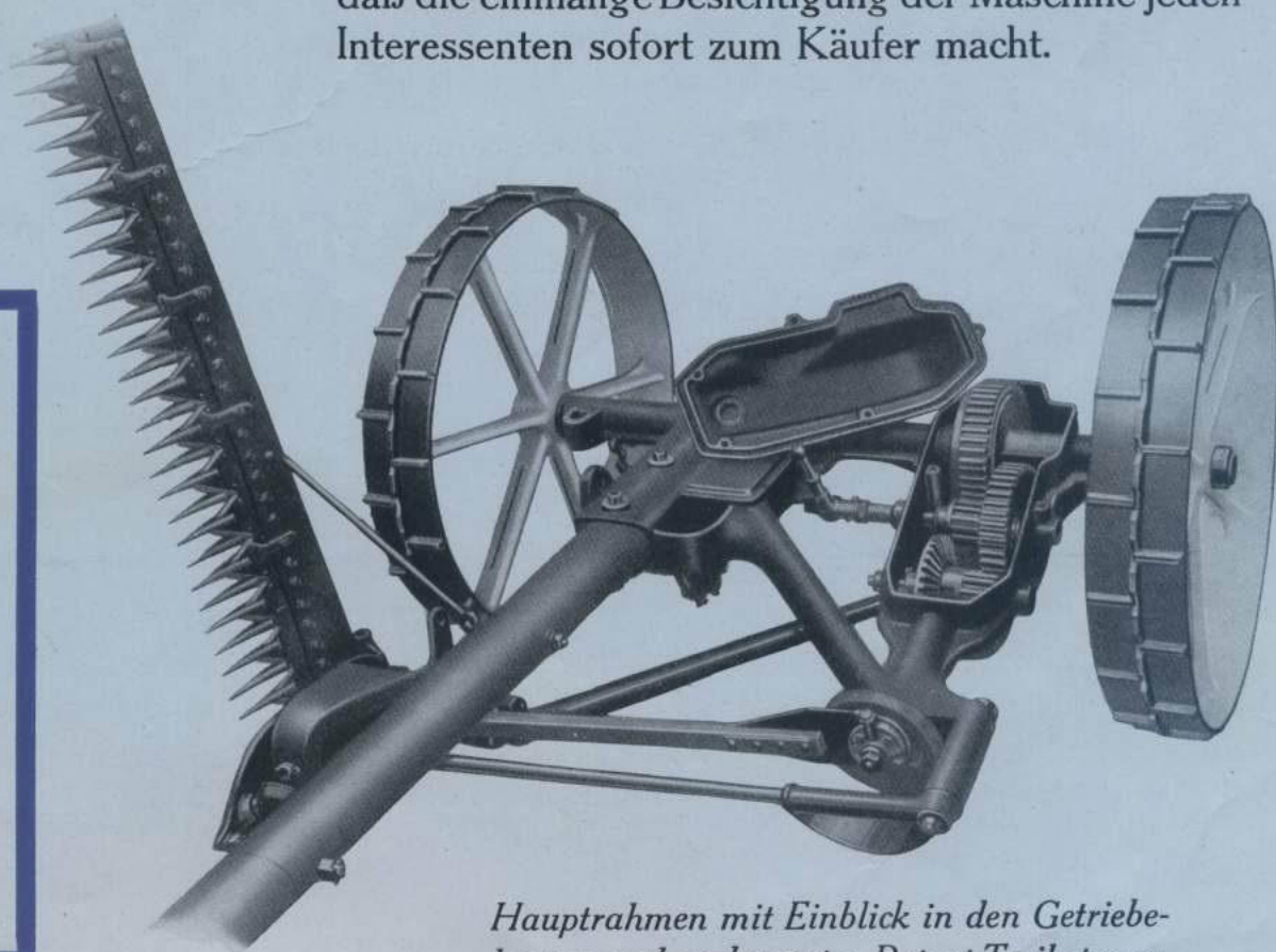
Hauptrahmen mit Einblick in den Getriebe- kasten und verbesserter Patent-Treibstange.

Zahnräder, der Kupplung gekapselten Getriebe- alle Wellen und die Haupt- nügt für das ganze Jahr. ser Gang, keine Zahn- usen. alkens mit selbsttätiger em Messer u. Senkrecht- schaltung des Getriebes. s Vorstoßen des Aufzug- esserte Patenttreibstange.