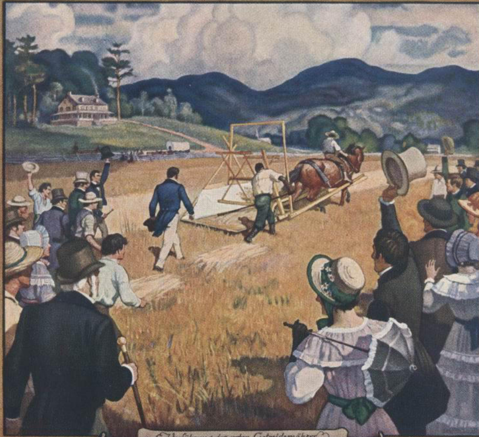
Vorführung des ersten Getreidemähers, eine Erfindung von C.H. McCormick in Virginia Juli 1831